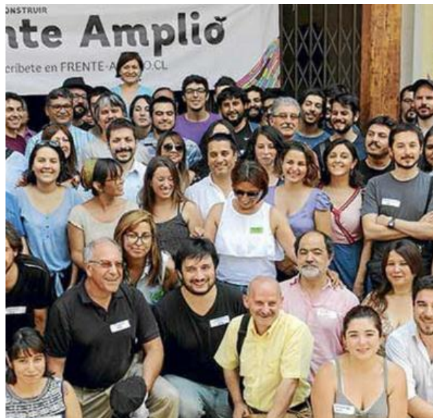
Nuevos parlamentarios izquierdistas del Frente Amplio

También se eligieron parlamentarios. Ya sabíamos que el Congreso era un circo, pero faltaban payasos profesionales. Bien, ahora llegaron. Es tragicómico verlos pues dan risa, pero es la Patria la que sufrirá con sus imbecilidades, las que pueden torcer nuestro destino en forma irreversible. Con sus narices rojas y chalupas son la prueba viviente de que este sistema no sirve. Salvo para decir ¡Adiós Patria!