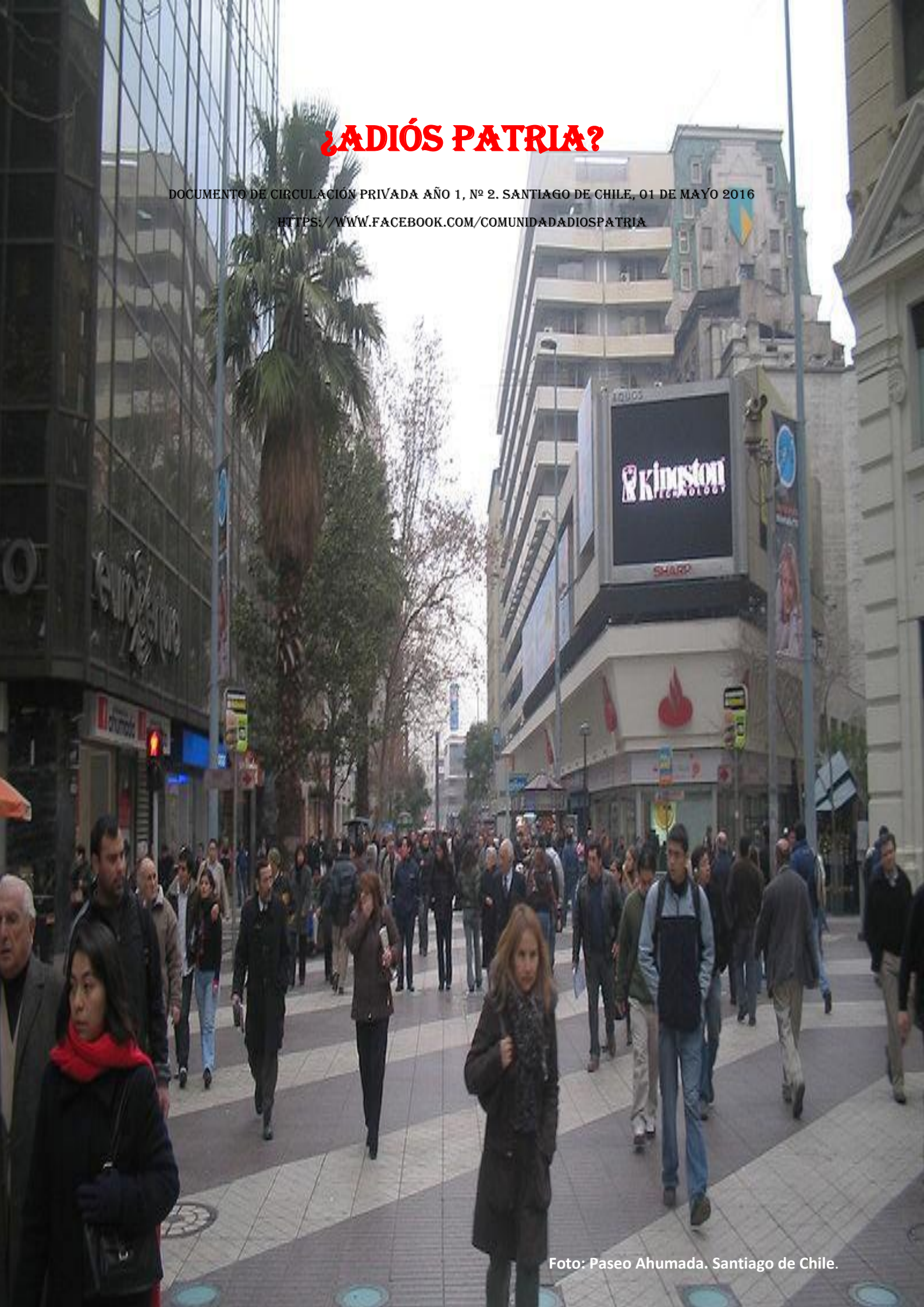
Foto: Paseo Ahumada. Santiago de Chile.

HTTPS://WWW.FACEBOOK.COM/COMUNIDADADIOSPATRIA