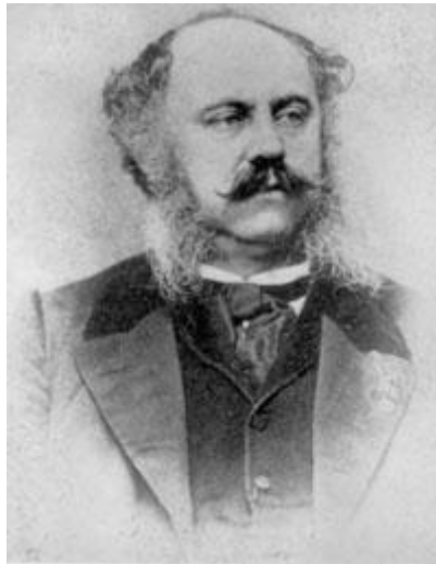
Sir John Retcliffe

El siguiente documento corresponde a una reunión nocturna y secreta que se celebró en el cementerio durante la Fiesta de los Tabernáculos.