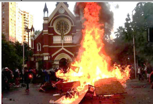
Iglesia San Francisco de Borja (1876) Santiago