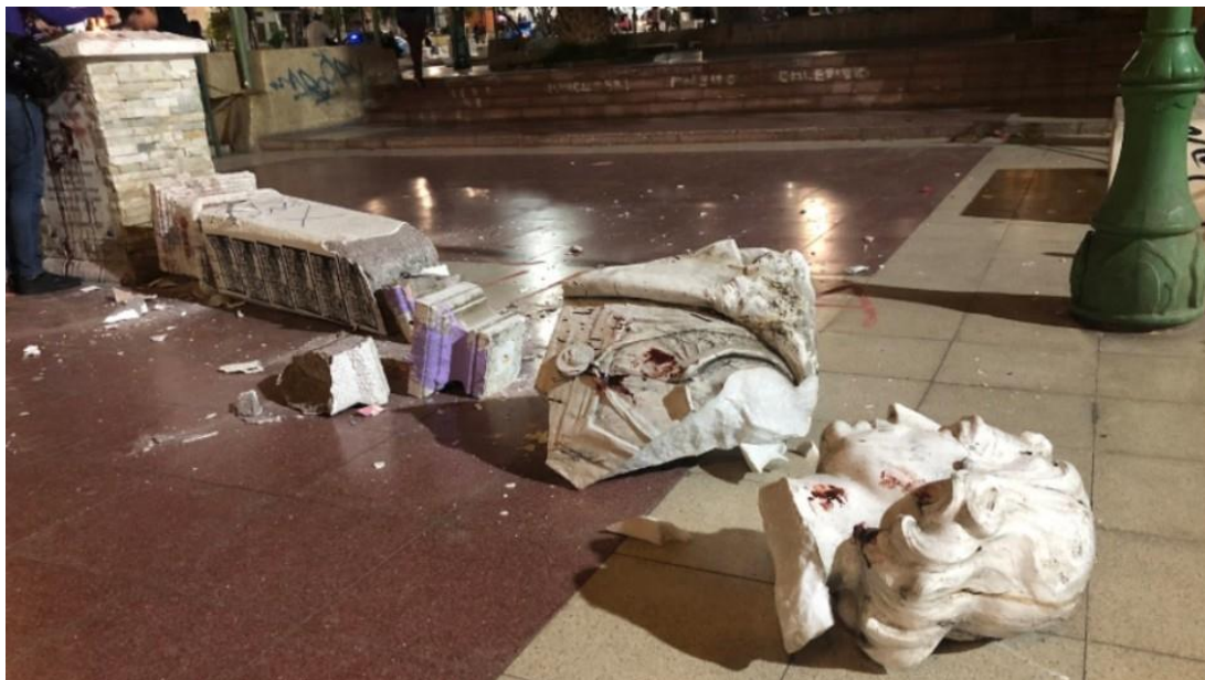
Cristóbal Colon. Plaza Colón. Concepción.