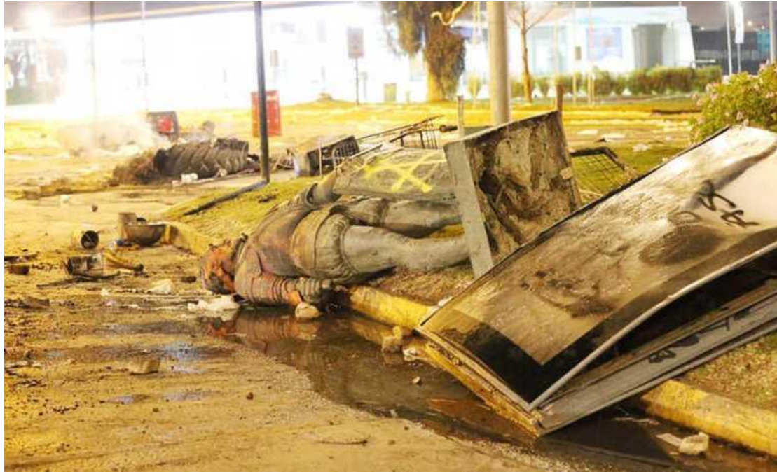
Don Francisco de Aguirre. La Serena.

¿Cuál es el objetivo de los subversivos revolucionarios comunistas de derribar los monumentos nacionales? Destruir nuestro sentido de Nación, olvidarnos de nuestros héroes y reemplazarlos por sus criminales.