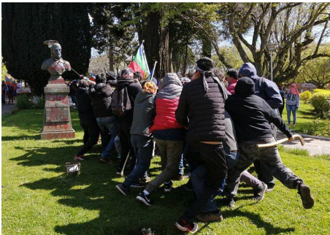
Don Pedro de Valdivia. Cañete.