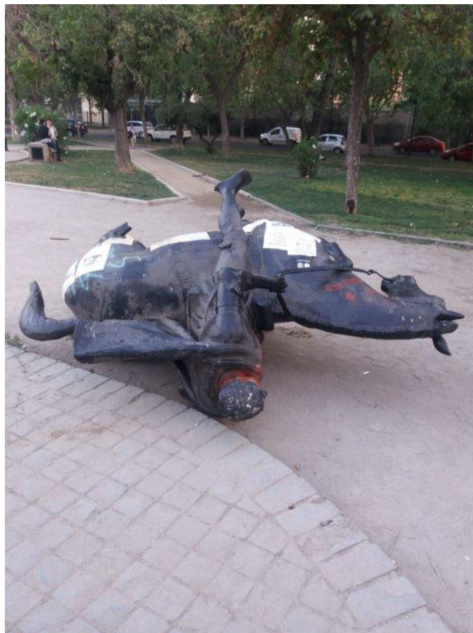
Don Diego de Almagro. Parque Almagro. Santiago.