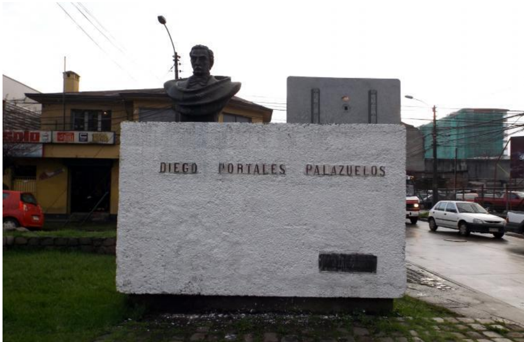
Don Diego Portales. Temuco.