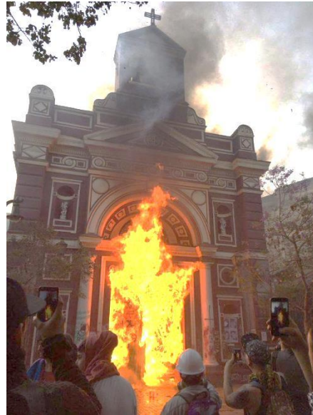
Iglesia de la Vera Cruz. (1852) Santiago