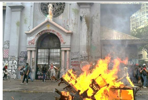
Parroquia de La Asunción. (1876) Santiago.