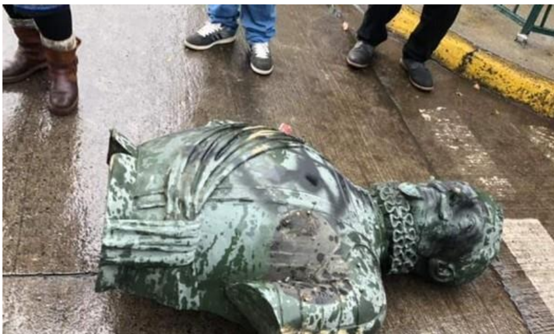
Don Pedro de Valdivia. Plaza Dagoberto Godoy. Temuco.