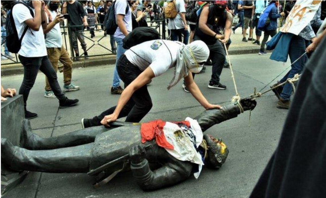
Don Arturo Prat Chacón. Plaza Dagoberto Godoy. Temuco.