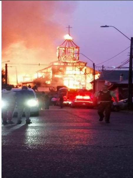
Iglesia de San Francisco -Ancud (1906)

Nos han informado que otra docena de Parroquias y Catedrales Católicas a lo largo de Chile han sido atacadas con pedrazos y rayados, pero aún no han sido incendiadas.