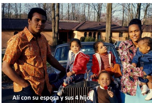
Alí con su esposa y sus 4 hijos

M.A: ¿Desesperación? Yo no tengo ninguna desesperación (Aplausos) Escucha, ninguna mujer en toda la tierra, ni siquiera las mujeres negras de países musulmanes pueden contentarme ni cocinar para mí ni socializar ni hablar conmigo como mi negra esposa americana, ninguna mujer, ni menos una mujer blanca. No podría identificarse realmente conmigo ni con mis sentimientos ni con mi manera de actuar ni de hablar. Y tú no puedes coger a un chino y darle una mujer puertorriqueña y si dicen “estamos emocional y físicamente enamorados” porque ella creció con música puertorriqueña y él creció con música china y ellos estarán en disonancia todo el tiempo. Es solo la naturaleza. ¡Tú puedes hacer lo que quieras!, pero es natural querer estar donde perteneces. Yo quiero estar donde pertenezco. Yo amo a mi pueblo eso es todo. No te odio (Aplausos).