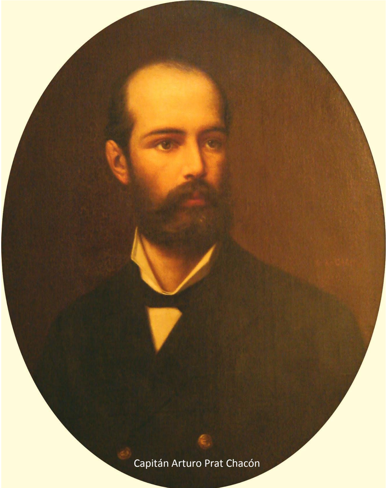
Capitán Arturo Prat Chacón

https://www.facebook.com/comunidadadiospatria