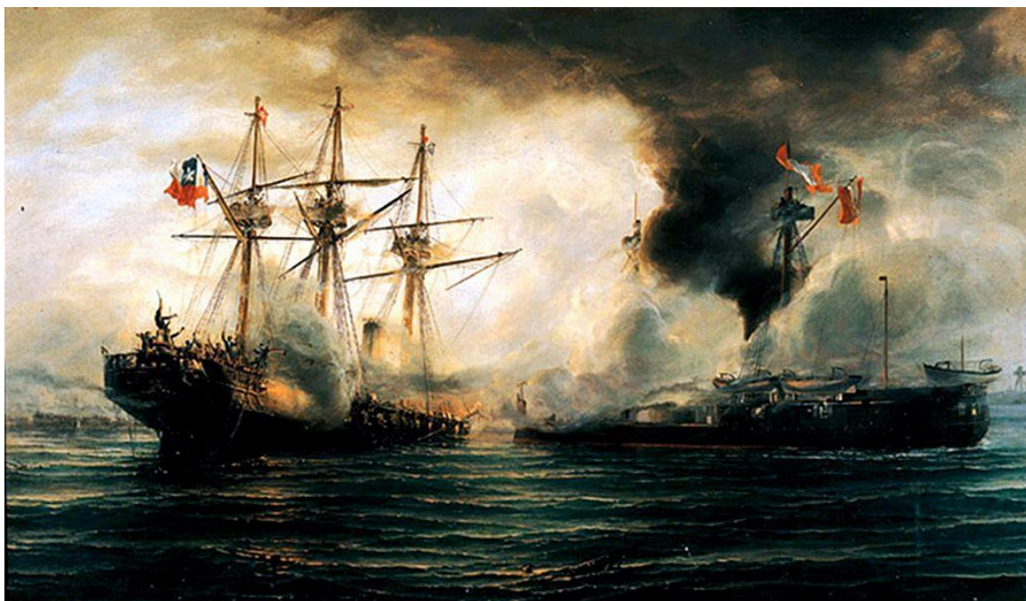
Thomas Somerscales (1842-1927)

«Hundimiento de la Esmeralda durante la batalla de Iquique» Óleo