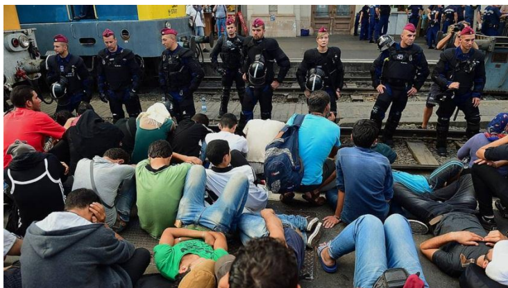
Refugiados en Estación de trenes Keleti. Budapest