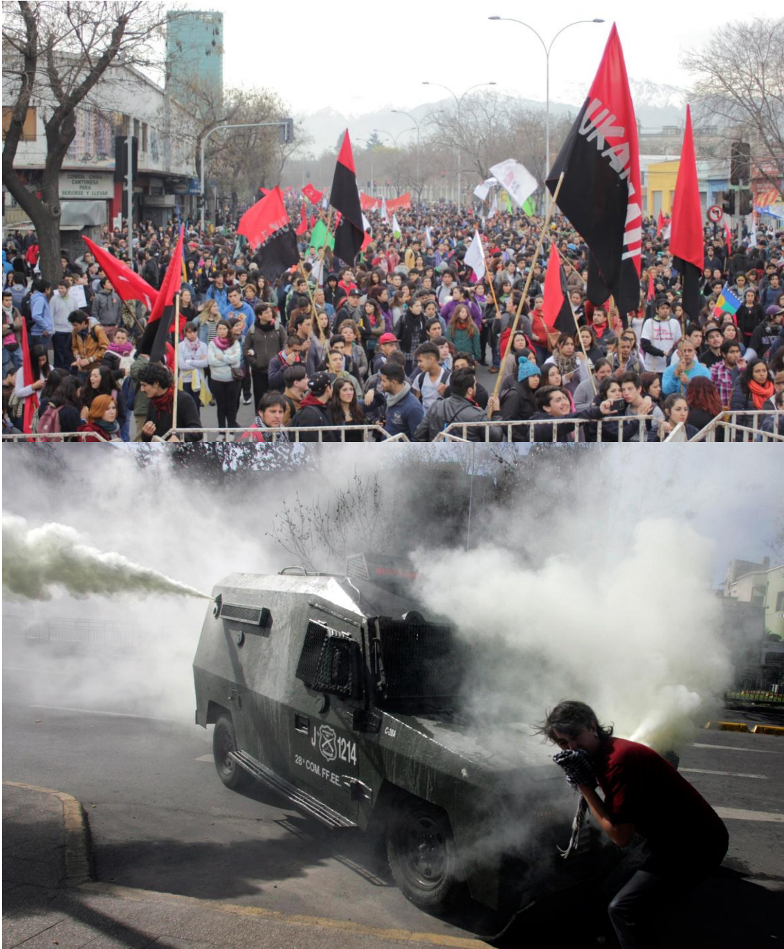
Concentraciones, marchas y desordenes izquierdista en Santiago

Boletín de circulación electrónica. Año 1, N°7. Santiago de Chile, 30 de Octubre 2016